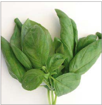
BASILIKUM GRÜN BASILIC VERT