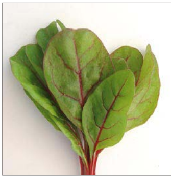
RED CHARD RED CHARD