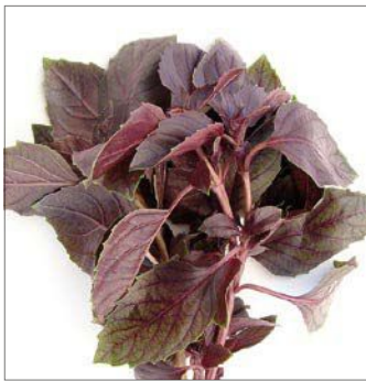
BASILIKUM ROT BASILIC ROUGE