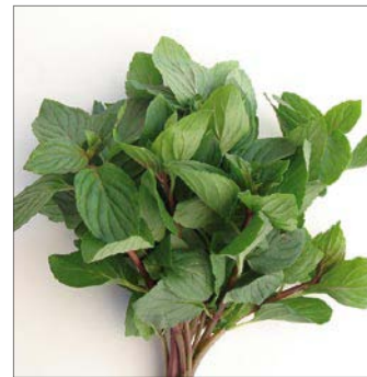
PFEFFERMINZE ROT MENTHE POIVREE ROUGE