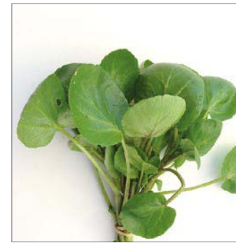
BRUNNKRESSE CRESSON DE FONTAINE