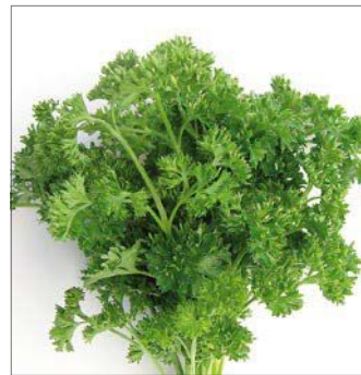
PETERSILIE GEKRAUST PERSIL FRISE