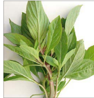
THAI BASILIKUM (SÜSS) BASILIC THAI (DOUX)