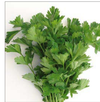
PETERSILIE GLATT PETERSIL PLAT