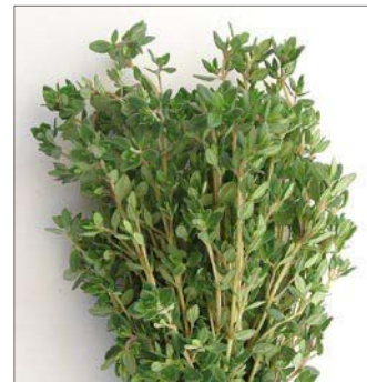
ZITRONENTHYMIAN THYM CITRON

FrISChe KÜchenkräuter für Augen- und Gaumenfreuden! Herbes de cuisine fraîches pour le plaisir des yeux et du palais!