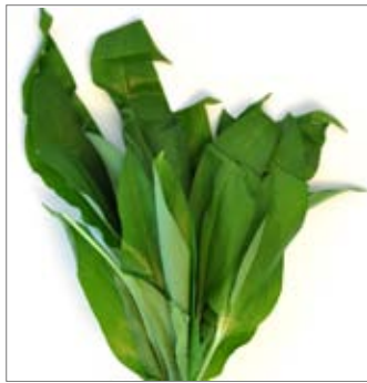
BÄRLAUCH AIL D'OURS März-Mai / mars-mai