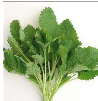
ZITRONENMELISSE MELISSE OFFICINALE